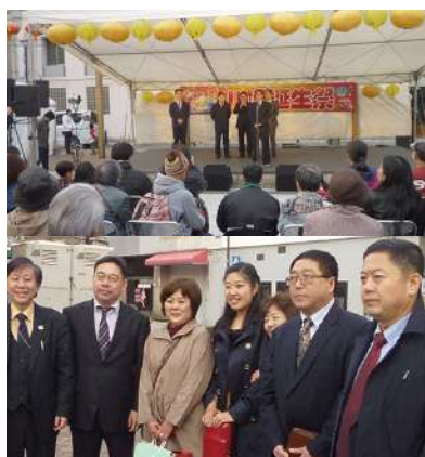
長崎街道黒崎宿春のランタン祭り