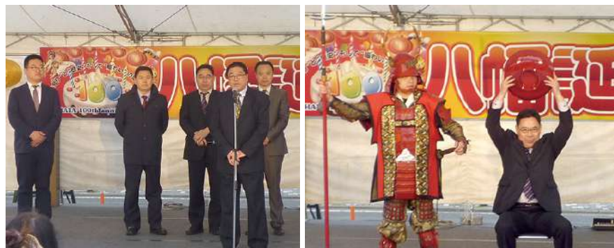
長崎街道黒崎宿春のランタン祭り