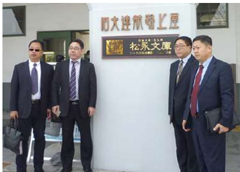
大連上屋視察・協議

3月19日(日)は2017日本商品大連巡回展、5月の訪日団、その他イベント等について協議致しました。