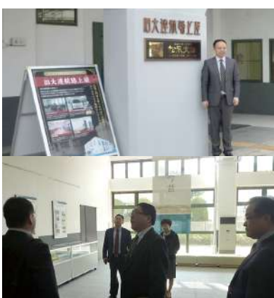
大連上屋視察・協議