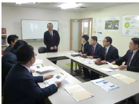
しんこう 工場見学